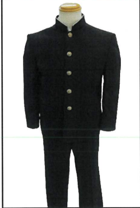
I型・・・男子体型向け