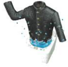
I 型 ブレザー