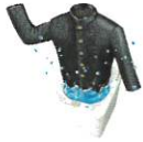
II 型 ブレザー