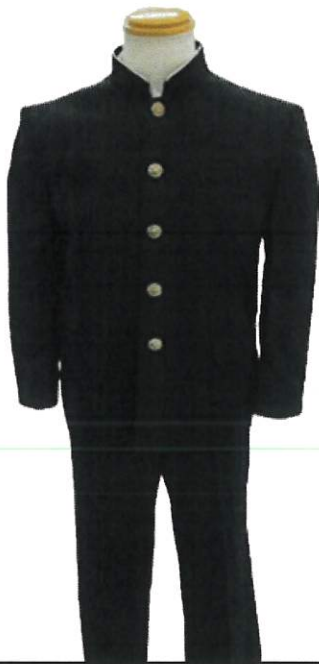
I型・・・男子体型向け