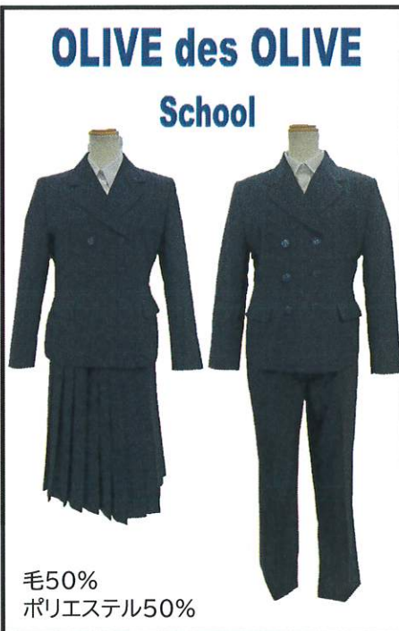
II型・・・女子体型向け