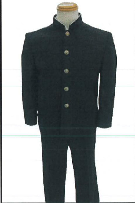
I型・・・男子体型向け